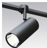
Adaptateur NOA S